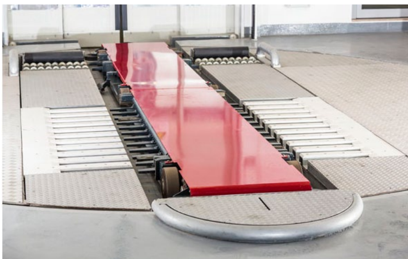
איור 1. משנע Silomat®

הרכבים מונעים מהכניסה/יציאה על ידי משנע Silomat® המרים את הרכב מהצמיגים באופן בטוח וזאת לאחר מרכוזו באופן אוטומטי בציר האורכי בלובי הכניסה.