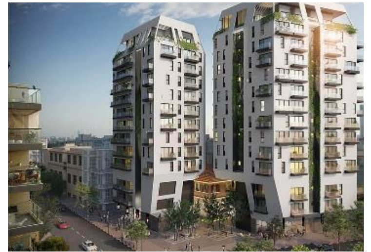
הרצל 136-138 תל אביב חניון רבובטי הכולל 109 מקומות חניה