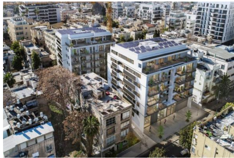
וולפסון 55-57/מטלון 78-80 תל אביב חניון רבובטי הכולל 120 מקומות חניה