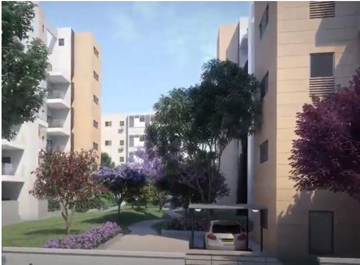
עמינדב 16-18-20 חניון רבובטי הכולל 150 מקומות חניה

הפרויקטים שלהלן כבר לקראת מסירה לשימוש הדיירים: